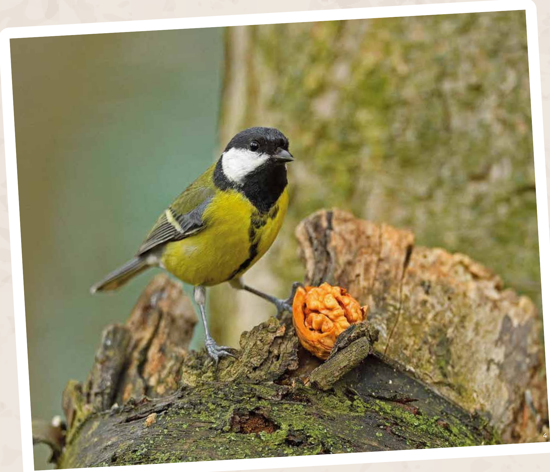
Štvrtou a poslednou je stromová etáž. Nájdem tu živočíchy žijúce v dutinách stromov ako ďatle, veвериčky a plchy, ale tiež spevavce ukrývajúce sa v korunách stromov.