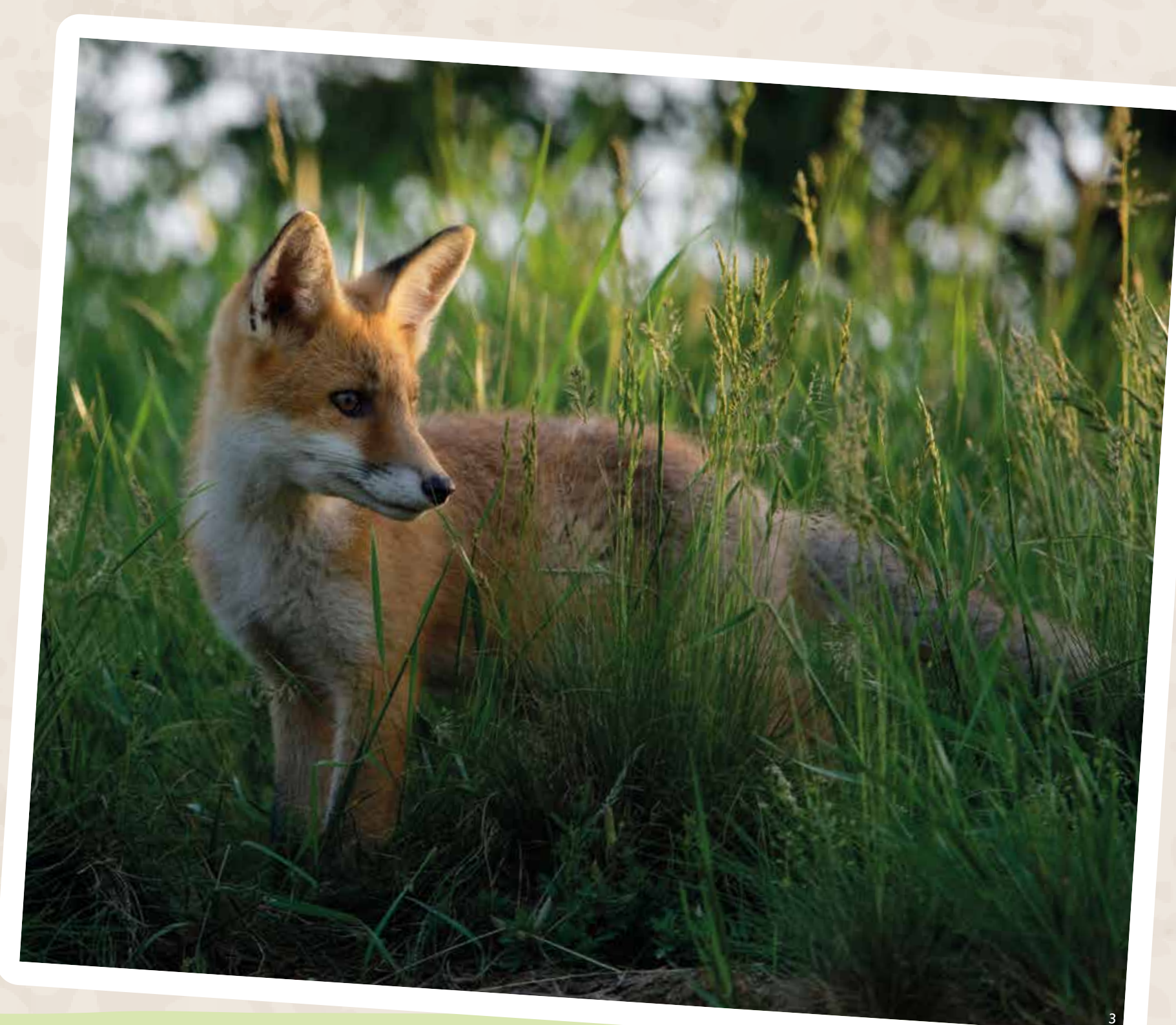
Kerová etáž lesa je miestom pre väčšie cicavce ako líšky, srny a diviaky. Spevavce si tu hľadajú svoju potravu - plody.