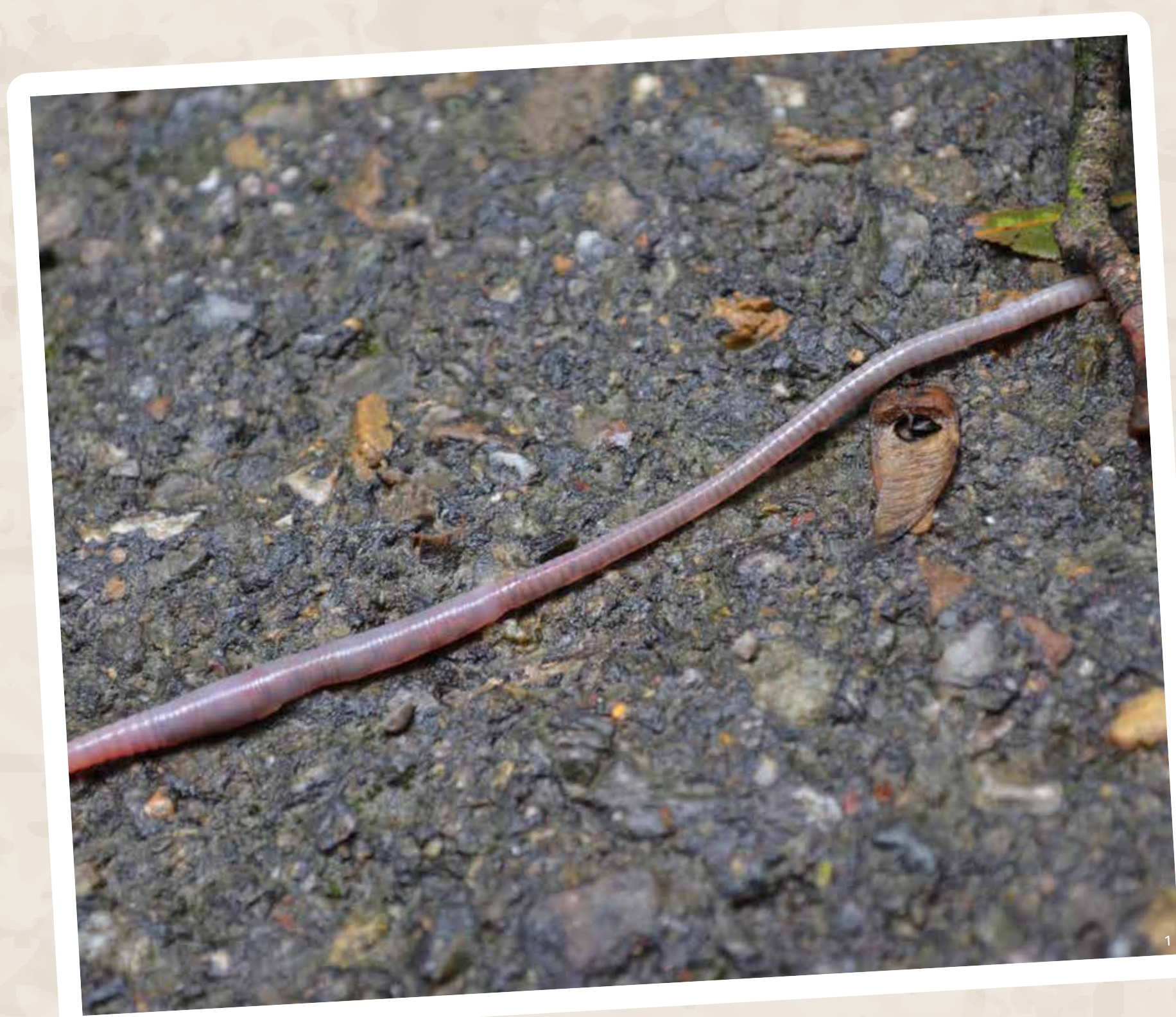
Najspodnejšou etážou lesa – akoby „pivnicou“ – je pôdna etáž, ktorá sa hmýri dážďovkami a stonožkami, tu i tam si v nej nájdú svoje miesto lišaje, machy a drobné huby.